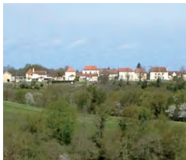
Vue sur Mesplède