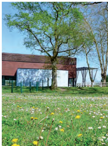
La salle des Ponts Jumeaux