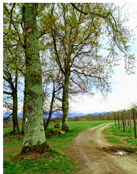
Sur les hauteurs, chemin du Trépé