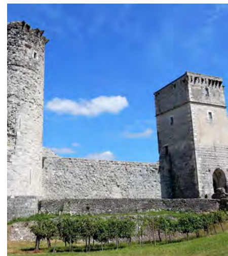
Château de Bellocq