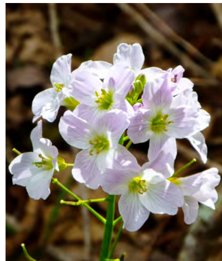
Cresson des prés