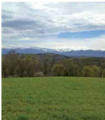
Vue sur la chaîne des Pyrénées