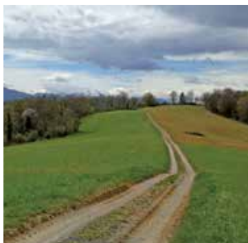
Le chemin entre bois et panorama