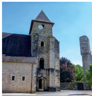
L'Église de Lucq-De-Béarn